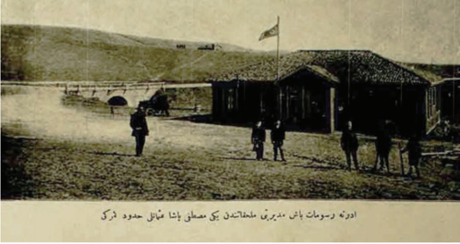
EK-4 Edirne Rüsûmat Baş Müdüriyeti'ne bağı Yeni (Cisr-i) Mustafa Paşa Osmanlı Hudud Gümrüğü.