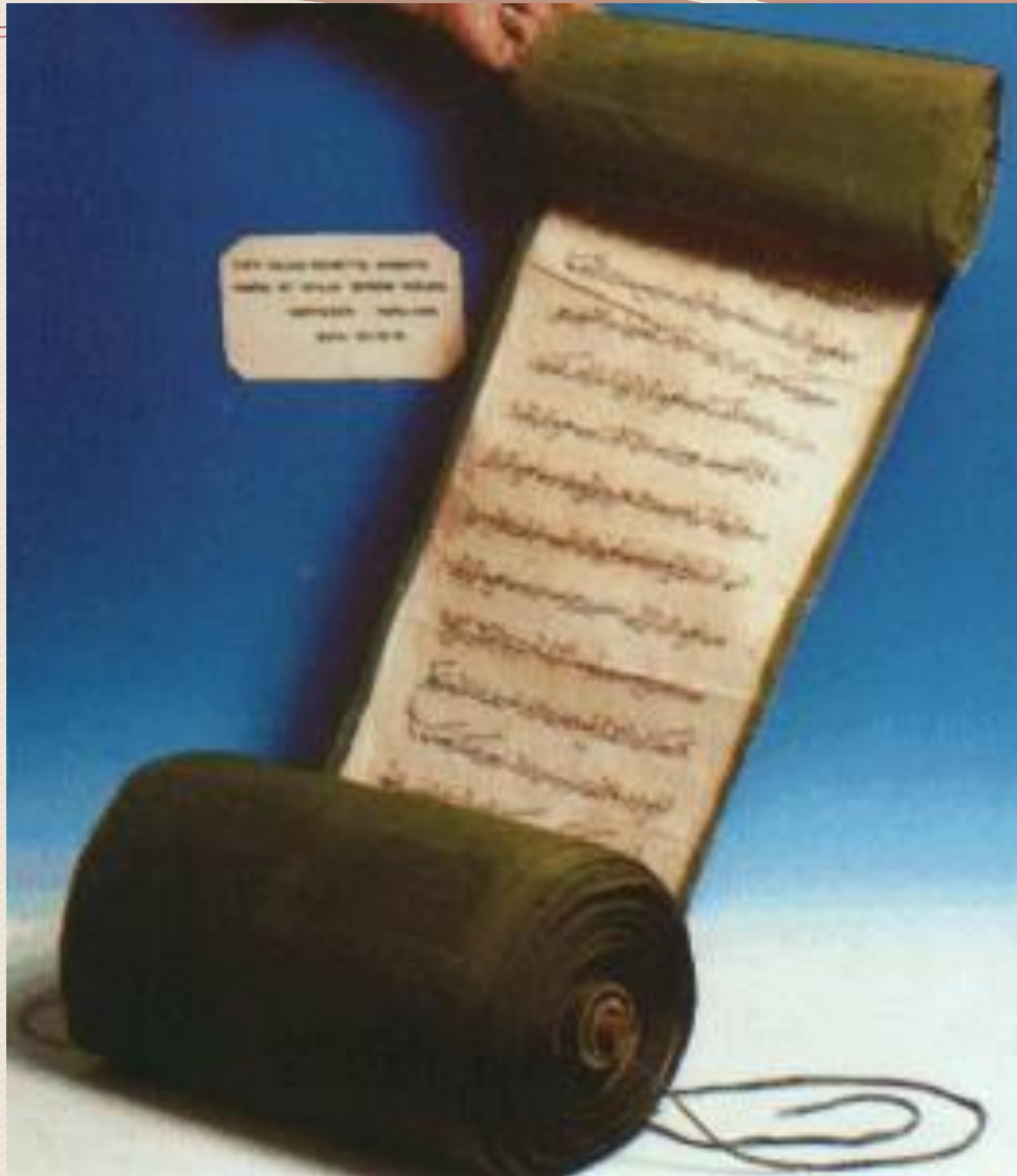
Fatih Sultan Mehmet Kanunnamesi