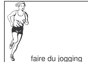
faire du jogging