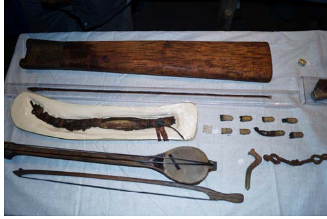
Resim 4: MS.7.yy. Altay Dağlarında Bulunmuş Olan Kopuz (Erişim Tarihi: 08.04.2017, http://www.tika.gov.tr/tr/haber/altay_daglari%27ndaki_kazilar_turk_tarihine_isik_tutuyor-18662 )