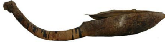
Jargalant-Hayrhan'daki kaya mezarda bulunan kopuzun' görüntüsü