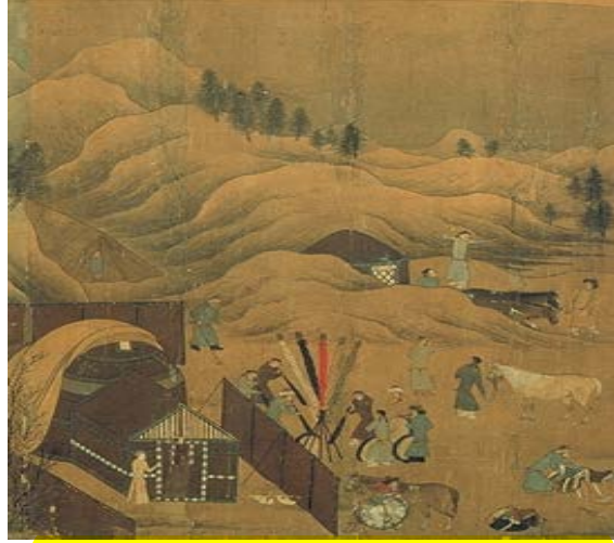
Resim 1: Hun Dönemi Hanlık Otağı, MS. 2 yy.'a ait Çin Prensesin Şiirine Dayanarak Çizilmiş olan Tuğ Takımı sahnesi. Ts'ai Wen Chi Şiire ait Başka Bir Resim, 11. yy. (Tayvan Ulusal Saray Müzesi)

Bu döneme ait musikinin kendine ait bir karakteristiği olduğu, oldukça çok çeşitteki enstrüman ile icra edildiği görülmüştür. Kendi içinde tür olarak; saray musikisi, askeri musiki ve halk musikisi olarak (ozan kopuzculuk) kendi içinde ayrışabileceği değerlendirilmektedir.