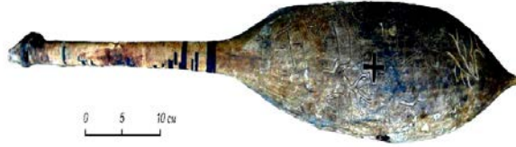
Jargalant-Hayrhan'daki kaya mezarda bulunan kopuzun' görüntüsü