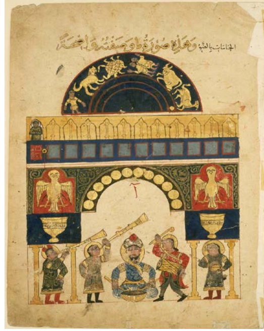
Resim 5: Saraya Ait Nevbet Takımı (Kaynak: Al-Jazari's "Book of Knowledge of Ingenious Mechanical Devices": The Castle Water Clock, Boston Gzel Sanatlar Mzesi, Ac.Nu.:14.5339)