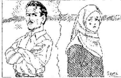
S. S. S.

Evet, ebedî hayal arkadaşlığı, dünyaya ve âhîrî mutuluk, âlemler karşılığı olarak birbîrlerini günahardan koruyup bir "kîv" olma... İslâmın evliler