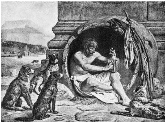
Resim 4.3 Kinik Diogenes'i Elinde Lambası ve Etrafında Köpekler ile Gösteren Bir İllüstrasyon

Kinikler Okulu'nun kurucusu Atinalı Antisthenes'tir. MÖ 444-368 tarihleri arasında yaşamış olan Antisthenes'in annesi Trakyalı bir köledir. Babası ise yoksul bir Atinalıdır. Antisthenes önce Sofist Gorgias'ın öğrencisi olmuştur. Daha sonra ise Sokrates'in dostluğunu kazanmıştır. Kinikler Okulu'nun adını nereden aldığına dair iki farklı rivayet vardır. İlkine göre Kinik adı, okulun kurulduğu yerden, yani Kynosargos'tan gelmektedir. İkinci yoruma göre ise, Kinik adı, eski Yunancadaki kyon dan, Türkçe karşılığı ile köpek ten gelmektedir. Bunun gerekçesi ise okulun önde gelenlerinin, özellikle Diogenes'in köpekçe bir yaşam sürmesidir. Tıpkı bir köpek gibi çevrelerindeki insanlara karşı hırçın ve saldırgan bir tutum içinde olmaları sebebi ile bu okulun temsilcilerine Kinikler denilmiştir. Dahası, Kinikler hiçbir töreye, hiçbir nezaket ve edep kuralına saygılı değildirler. Mükün merteye yoksul bir hayat sürmeyi tercih ederler. Bütün uygarlık değerlerine saldırlar. Neticede sıralanan bu tipik özellikleri ile bir köpeği andırıyor olmaları, onlara Kinikler denilmesine yol açmıştır.