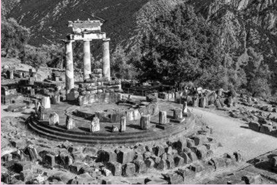
Resim 4.2 Delphi'deki Apollon Tapınağı

“Eğer tek bir şey biliyorsam, o da hiçbir şey bilmediğimdir.” Bu söz, Delphi kâhininin kendisi hakkında yaptığı ileri sürülen bir kehanetle ilgili olarak karşımıza çıkmaktadır. Platon'un ve Ksenophon'un aynı adı taşıyan Sokrates'in Savunması adlı kitaplarında sözünü ettikleri bu kehanet olayı şudur: Sokrates'in uzun zamandan beri dostu olan ve herhalde yaşayışı ve düşüncelerinden çok etkilenen Khairephon bir gün Delphi'ye gitmiş ve orada bulunan Apollon tapınağının kâhinine insanlar arasında Sokrates'ten daha bilge birinin bulunup bulunmadığını sormuş, bu soruya kâhinin cevabı “Hayır” olmuştur.