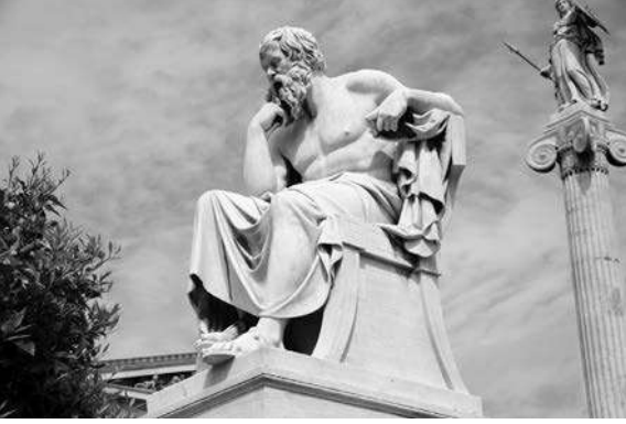
Resim 4.1 Büyük Düşünür Sokrates'in Heykeli