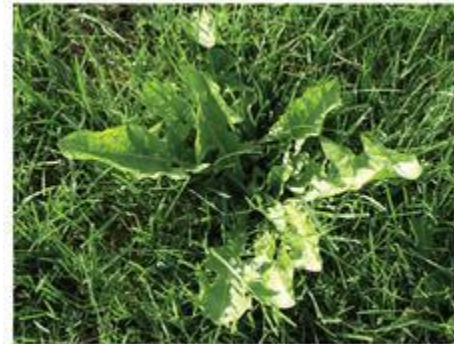
BEFORE TREATMENT WITH FIESTA