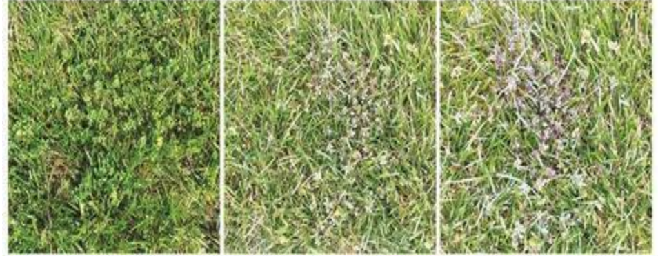
Oxalis 24 hours after Fiesta® Treatment