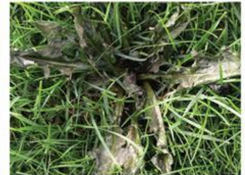
24 HOURS LATER