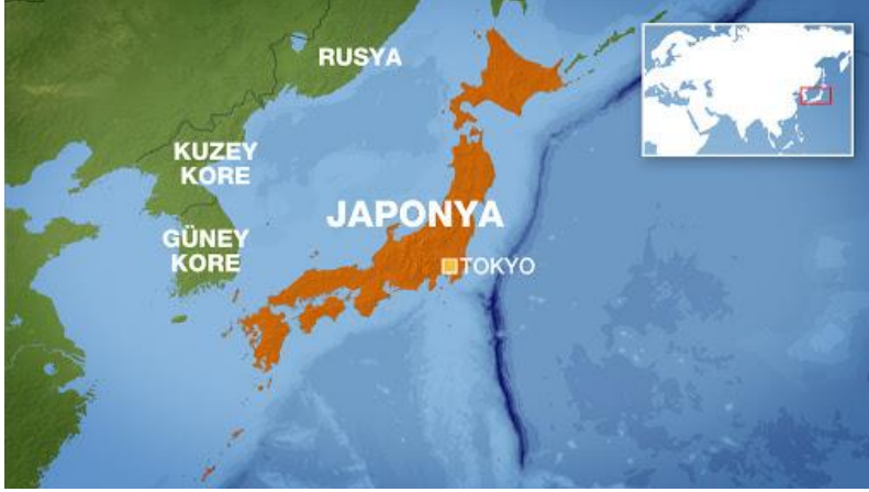
Görsel 1: Japonya'nın Konumu

Japonya, Hokkaido, Honshu, Shikoku ve Kyushi adlı dört büyük ada ile binlerce adacıktan oluşan bir ülkedir. 2019 yılı verilerine göre Japonya'nın nüfusu 126.17 milyondur (Statistics Bureau of Japan, 2020). Yüz ölçümü 377.899 km 2 olan Japonya'nın ülke topraklarının %84'ü tarıma elverişsizdir.