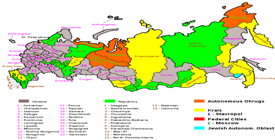
Görsel 2: Siyasi görünüm

Rusya, başkanlık sistemiyle idare edilen, kendi anayasaları ile yasama ve yürütme organlarına sahip 21 cumhuriyet, 9 eyalet (Kray), 46 bölge (Oblast), 2 federal statüye sahip şehir (Moskova ve St. Petersburg). 5 özerk bölgeden (Avtonomnaya Oblast/Avtonomniy Okrug) oluşan, 83 idari birimli bir federasyondur.