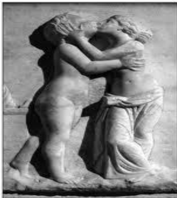
Alman Tülay Tü, 2007. İstanbul Arkeoloji Müzesi