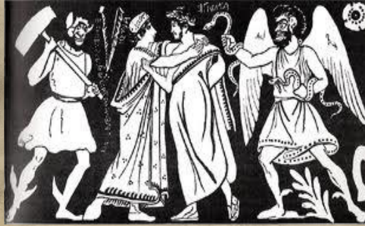
Alkestis ve Admetos