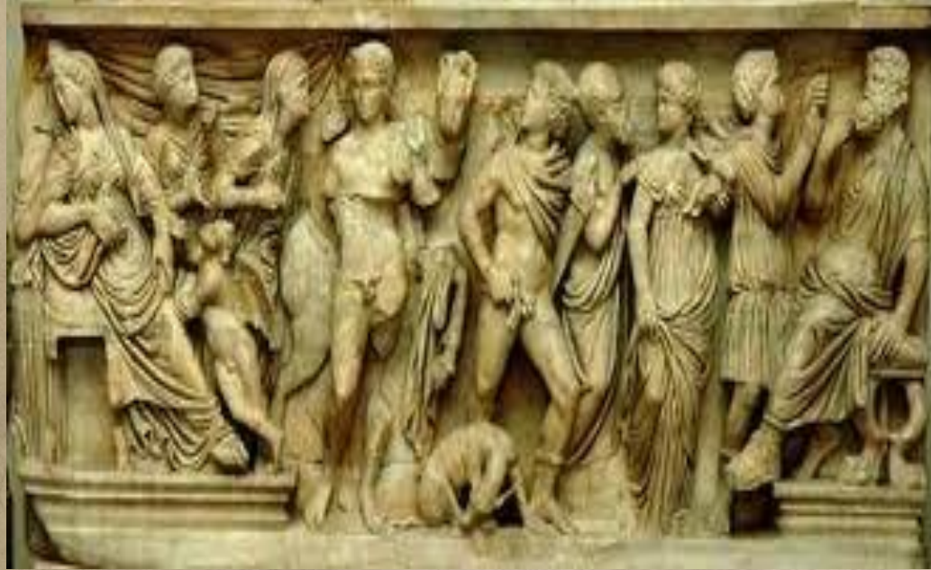
Hippolytos ve Phaidra