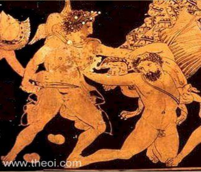
Hermes ve Hippolytos