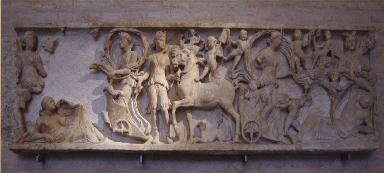
Endymion Laidi M.S.3.yy.