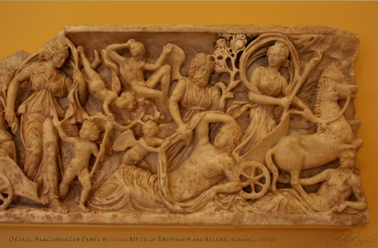
DETAIL, SARCOPHAGUS PANEL WITH THE MYTH OF ENDYMION AND SELENE, ROMANIC, 1040-10