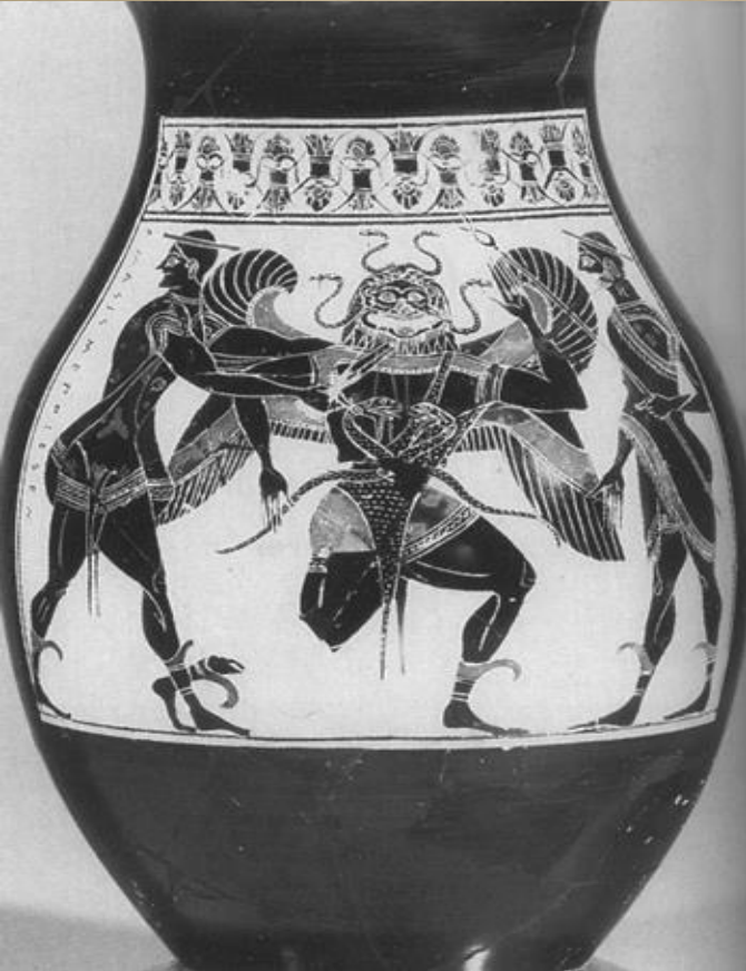
Perseus Gorgo Hermes