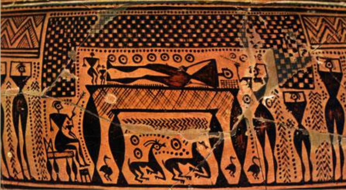
Geometrik Dönem, krater üzerinde prothesis (ölüye saygı) betimlemesi