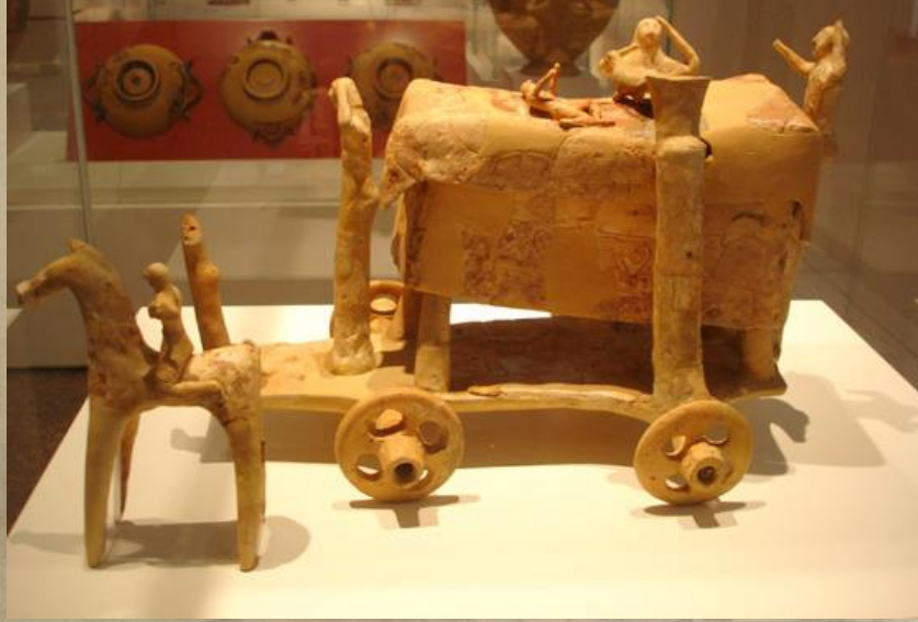
Ekphora (sevgili kiřiden ayrılıř), terracotta grup, Atina Ulusal M zesi