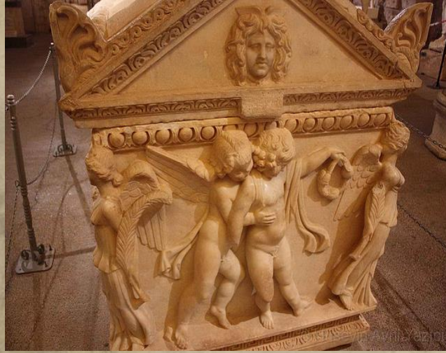
Side Müzesi Eroslu lahit

Ölüm ve ölen kişi, Roma uygarlığının her döneminde saygı görmüş ve ölüye gerekli saygıyı göstermek için çeşitli törenler yerine getirilmiştir. Ancak antik dönemde büyük bir coğrafyaya yayılan Roma uygarlığının her yöresinde, aynı adetlerin kurallar çerçevesinde sıkı sıkıya uygulandığını düşünmek de çok doğru değildir.