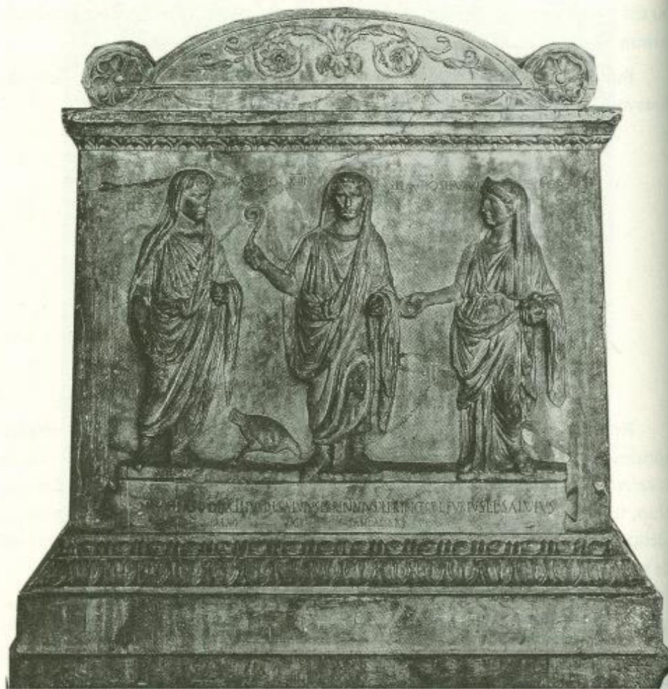
Fig. 64: Lares Altari