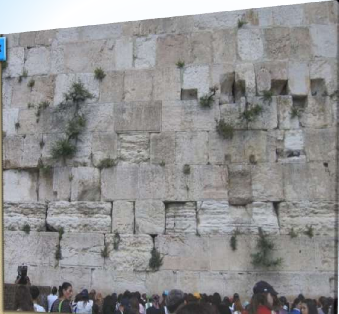
Photo © 2009 Wikimedia Commons Richard Elliott, a person in the Wikimedia Commons © 2009 from the Commons