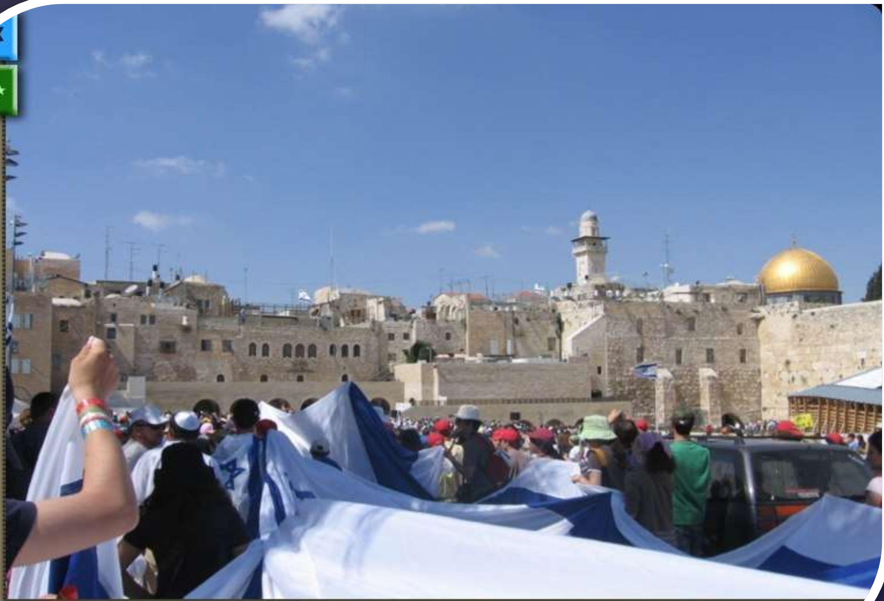
The Western Wall, Jewish flags, and the Dome of the Rock

WORLD RELIGIONS: A Guide to the Essentials • © 2006 Tom Robinson