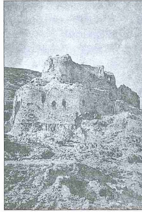
Bagrâs Kalesi ve kalenin planı

Sözlükte "haktan ayrılmak, zulmetmek, haddi aşmak" anlamına gelen bağy, fıkıh terimi olarak ifade ettiği siyasî anlamın yanı sıra "Allah'a karşı gelme, dinin çizdiği sınırları aşma" mânasında dinî - ahlâkî bir terim olarak da kullanılmaktadır. Kelime Kur'an-ı Kerim'de ve hadîs-i şeriflerde hem sözlük hem de terim mânalarında geçmektedir (mese-lâ bk. el-Kasas 28/76; eş-Şûrâ 42/27; el-En'âm 6/164; el-Hucurât 49/9; hadislerdeki kullanışları için bk. Buhârî, "Cihâd", 108, "Aḥkâm", 4; Müslim, "Fiten", 70-73). Dinî ve hukukî anlamlarda isyan eden