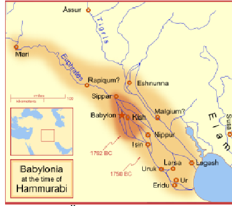
Şekil 2. M.Ö. 2000'lerde Babil Krallığı

İşçi sağlığı ve iş güvenliğinin gelişimine bakıldığında ilkel toplumlarda çalışanların sağlıklarını korumaya yönelik neler yapıldığına ilişkin somut bulgulara rastlanmamıştır. Bugünkü anlamda işçi sağlığı ve iş güvenliği olarak tanımlanabilecek çalışmalar ilk olarak köleci toplumlardan eski Roma'da gözlenmiştir. Bu dönemde bir çok bilim insanı bugün bile geçerli sayılabilecek çalışanların sağlık ve güvenliğine yönelik öneri ve savlar ileri sürmüşlerdir. Bunlardan ünlü tarihçi Heredot ilk kez çalışanların verimli olabilmesi için yüksek enerjili besinlerle beslenmeleri gerektiğine değinmiştir. M.Ö. 370 tarihinde Hipokrat (Hipokrates, MÖ 466-MÖ 379) ilk kez kurşunun zararlı etkilerinden söz etmiş, kurşun koliğini tanımlamış, halsizlik, kabızlık, felçler ve görme bozuklukları gibi belirtileri saptamış ve bulguların kurşun ile ilişkisini açık bir biçimde ortaya koymuştur. Roma İmparatorluğu döneminde toksikoloji oldukça ilerlemiş, bir çok bitkisel zehir, arsenik ve arsenik asidinin sülfid tuzları bulunmuştur. Dioscorides ise zehirleri bitkisel, hayvansal ve mineral kaynaklı olmak üzere kökenine göre üçe ayırmış ve bu ayırım yüzyıllar boyunca kullanılmıştır.