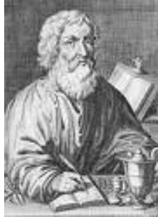
Şekil 3. Hipokrat (Hipokrates, MÖ 466-MÖ 379)

İşçi sağlığı ve iş güvenliğinin gelişimine bakıldığında ilkel toplumlarda çalışanların sağlıklarını korumaya yönelik neler yapıldığına ilişkin somut bulgulara rastlanmamıştır. Bugünkü anlamda işçi sağlığı ve iş güvenliği olarak tanımlanabilecek çalışmalar ilk olarak köleci toplumlardan eski Roma'da gözlenmiştir. Bu dönemde bir çok bilim insanı bugün bile geçerli sayılabilecek çalışanların sağlık ve güvenliğine yönelik öneri ve savlar ileri sürmüşlerdir. Bunlardan ünlü tarihçi Heredot ilk kez çalışanların verimli olabilmesi için yüksek enerjili besinlerle beslenmeleri gerektiğine değinmiştir. M.Ö. 370 tarihinde Hipokrat (Hipokrates, MÖ 466-MÖ 379) ilk kez kurşunun zararlı etkilerinden söz etmiş, kurşun koliğini tanımlamış, halsizlik, kabızlık, felçler ve görme bozuklukları gibi belirtileri saptamış ve bulguların kurşun ile ilişkisini açık bir biçimde ortaya koymuştur. Roma İmparatorluğu döneminde toksikoloji oldukça ilerlemiş, bir çok bitkisel zehir, arsenik ve arsenik asidinin sülfid tuzları bulunmuştur. Dioscorides ise zehirleri bitkisel, hayvansal ve mineral kaynaklı olmak üzere kökenine göre üçe ayırmış ve bu ayırım yüzyıllar boyunca kullanılmıştır.