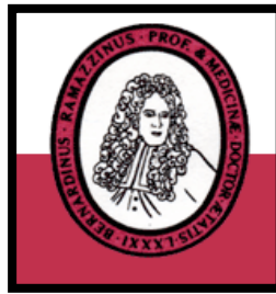
Şekil 4. Bernardino Ramazzini (1633-1714)

İşçi sağlığı ve iş güvenliğinde köklü ve çağdaş nitelikteki gelişmeler Bernardino Ramazzini (1633-1714) ile İtalya'da başlamış, bilimsel diyebileceğimiz iş hekimliği ortaya çıkmış fakat, gelişmelerin devamı sanayi devrimi sonrası İngiltere'de olmuştur.