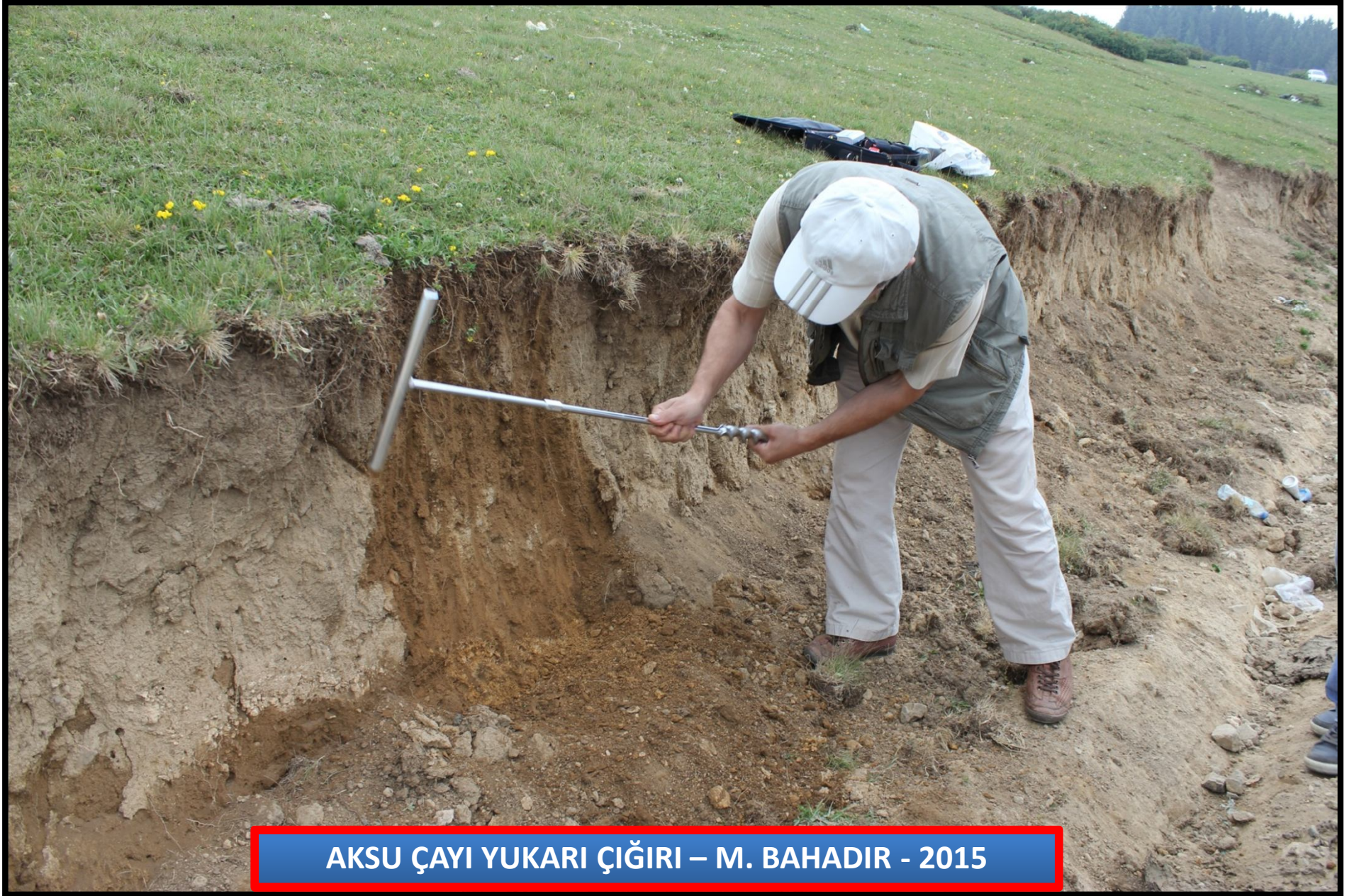
AKSU ÇAYI YUKARI ÇIĞIRI – M. BAHADIR - 2015