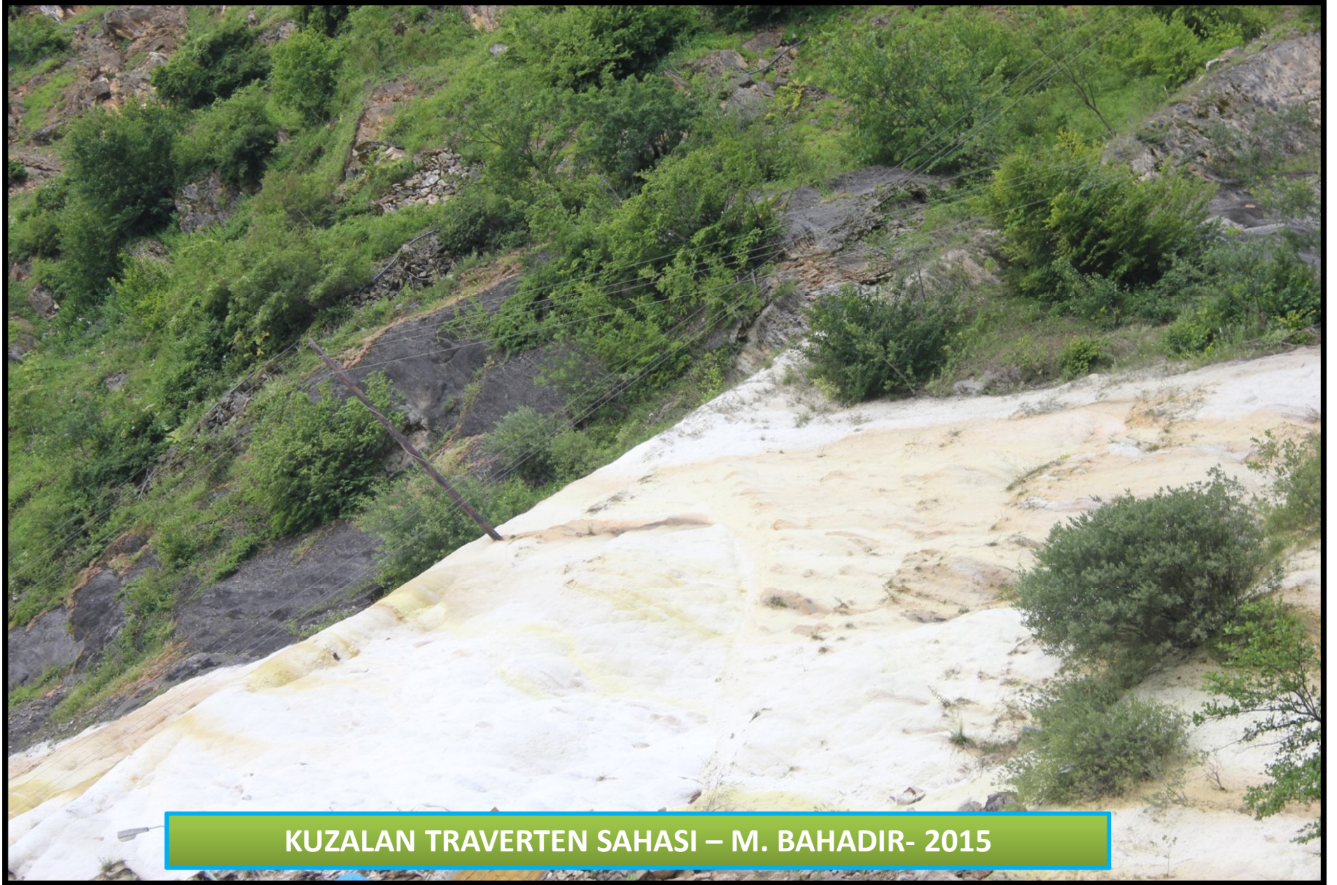
KUZALAN TRAVERTEN SAHASI – M. BAHADIR- 2015