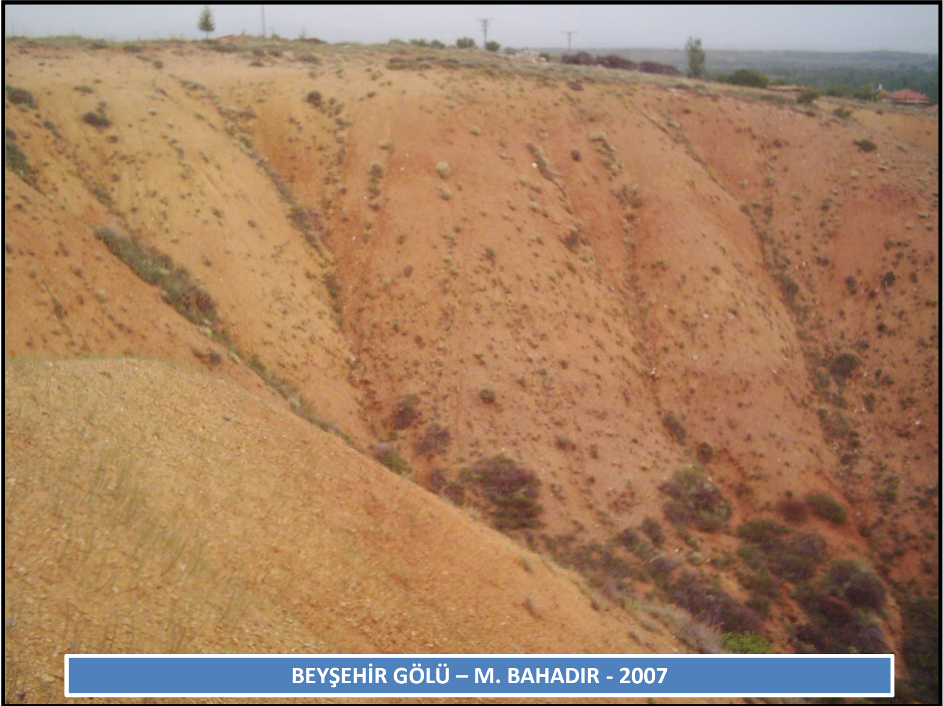
BEYŞEHİR GÖLÜ – M. BAHADIR - 2007