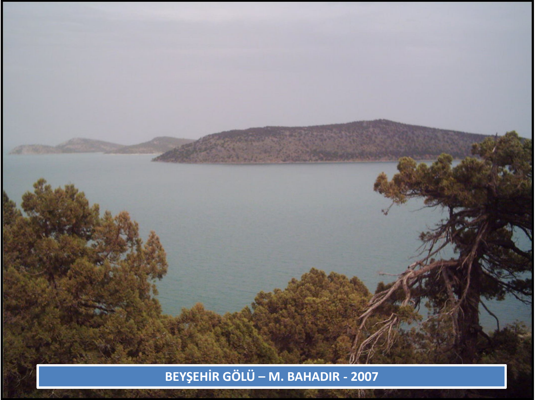
BEYŞEHİR GÖLÜ – M. BAHADIR - 2007