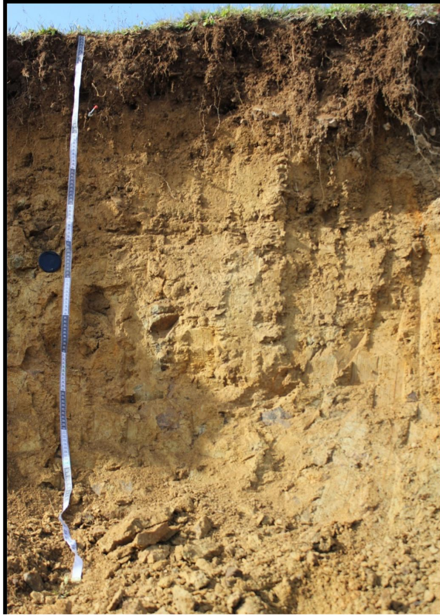
TOPRAK PROFİLİ – M. BAHADIR – AKSU ÇAYI- 2015