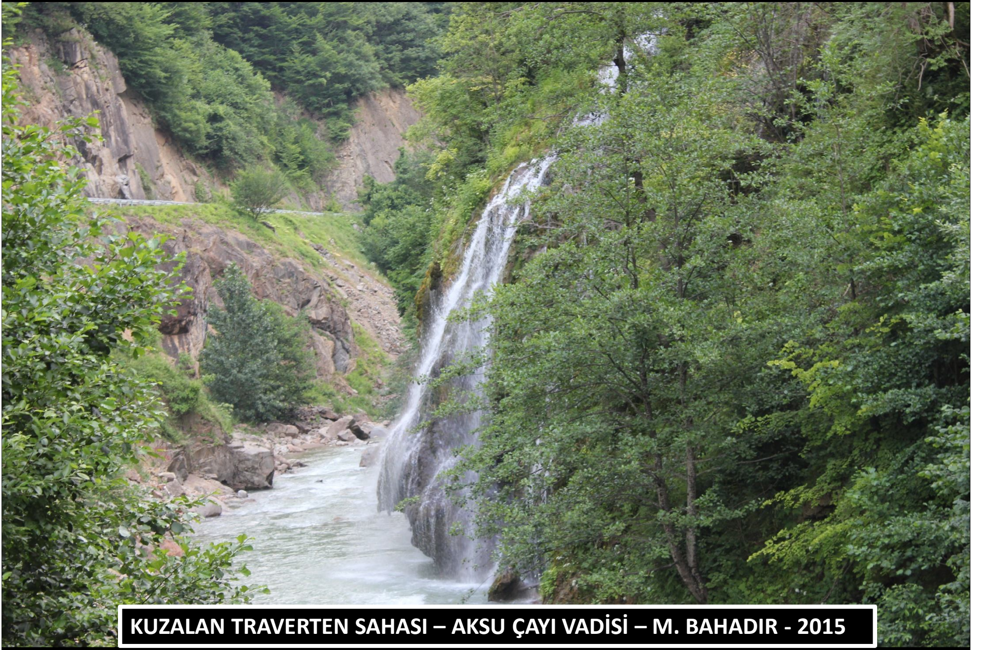
KUZALAN TRAVERTEN SAHASI – AKSU ÇAYI VADİSİ – M. BAHADIR - 2015