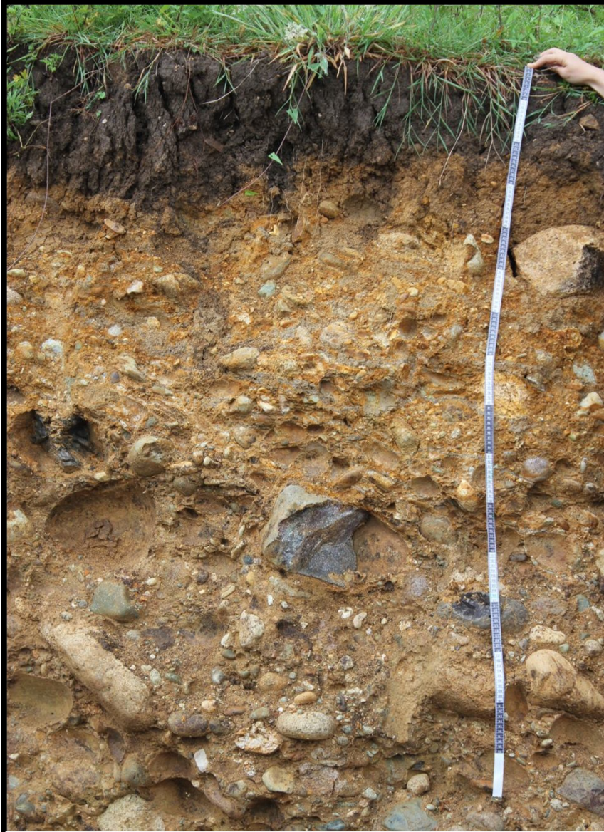
AKSU ÇAYI PROFİL – M. BAHADIR - 2015