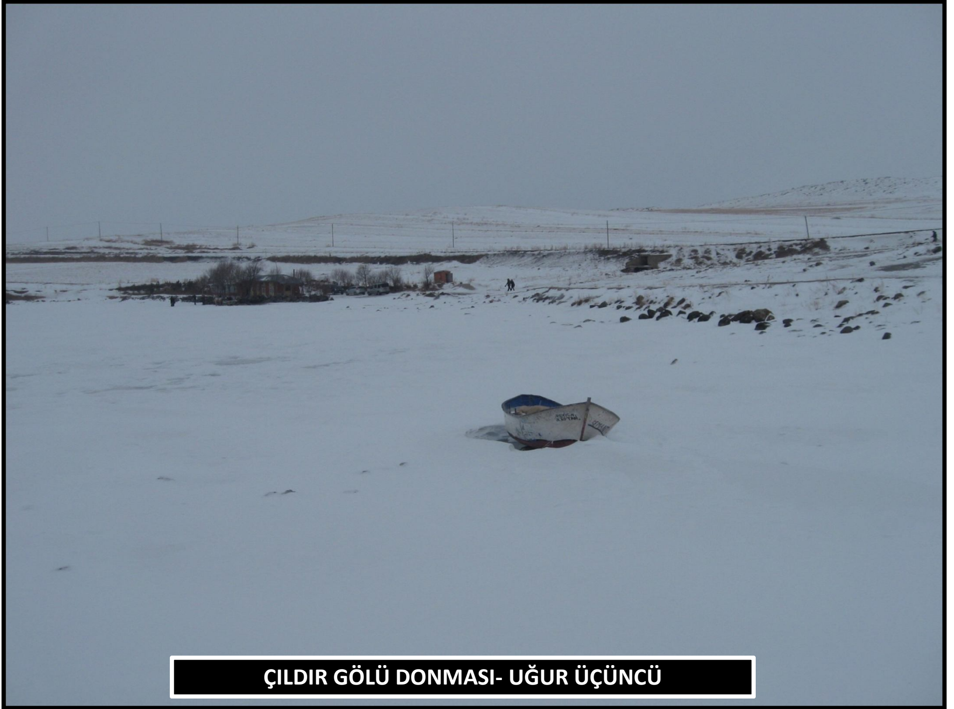
ÇILDIR GÖLÜ DONMASI- UĞUR ÜÇÜNCÜ