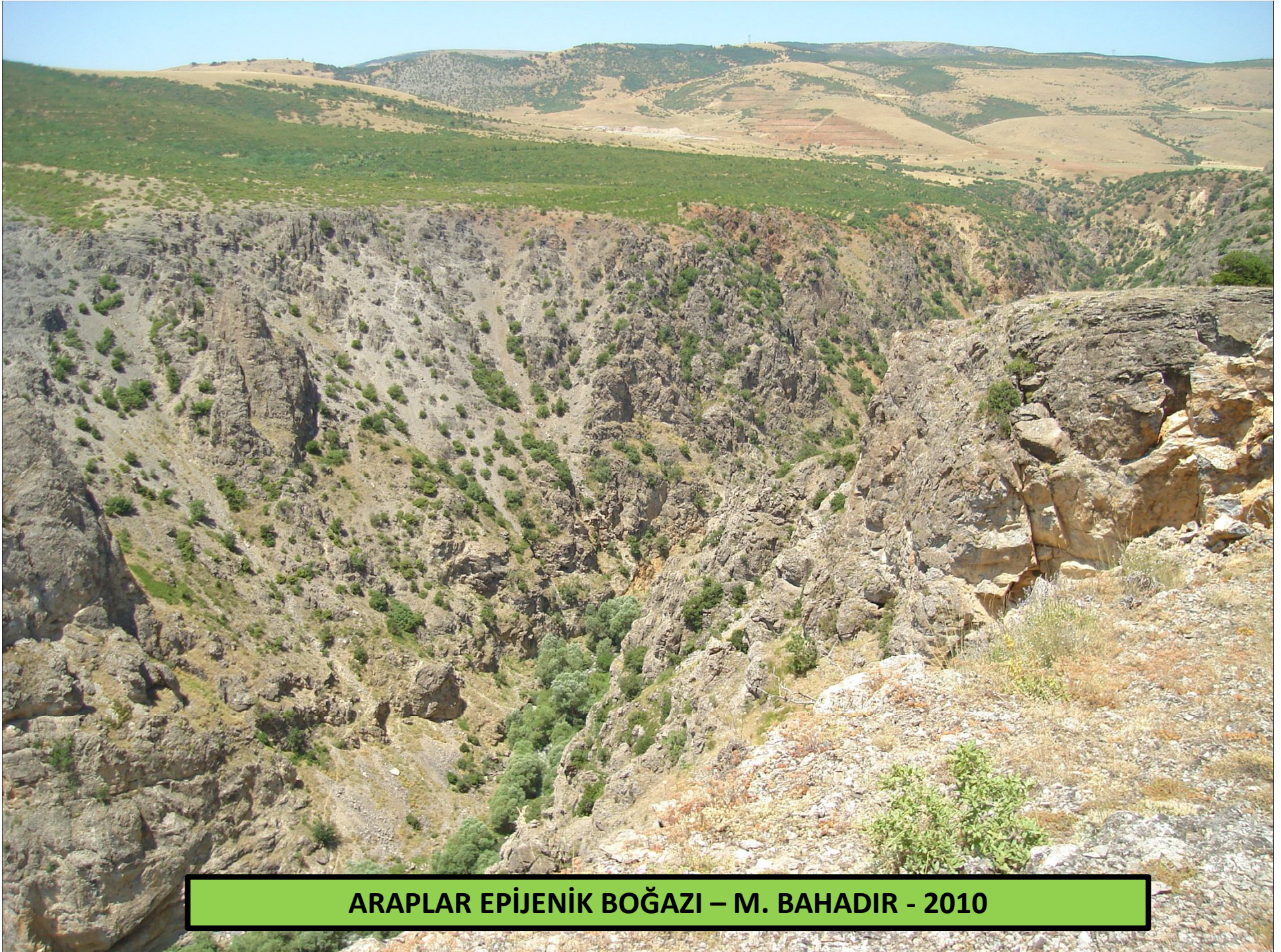
ARAPLAR EPIJENİK BOĞAZI – M. BAHADIR - 2010