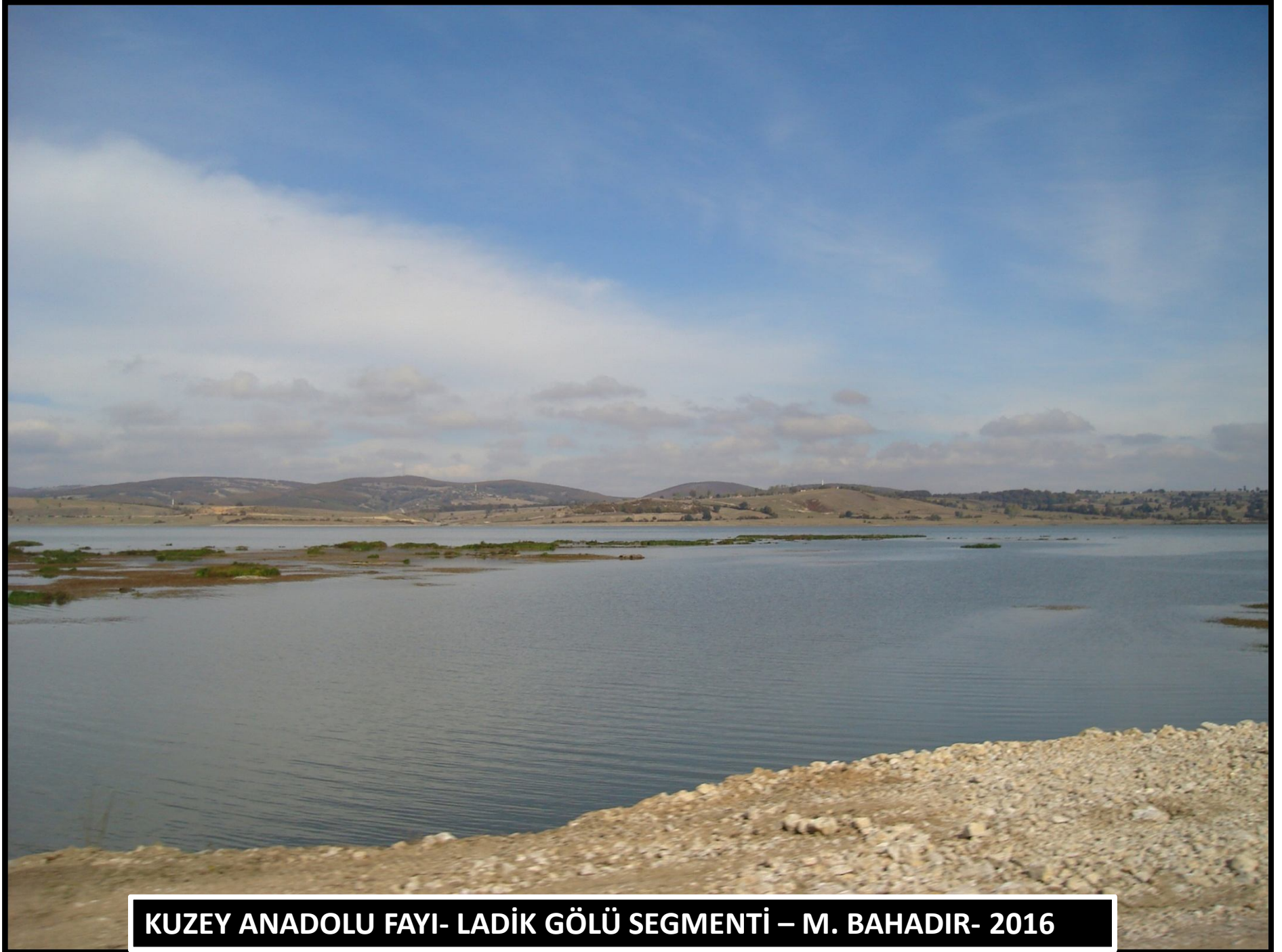
KUZEY ANADOLU FAYI- LADİK GÖLÜ SEGMENTİ – M. BAHADIR- 2016