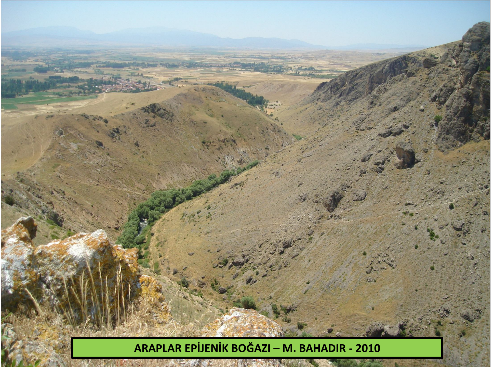
ARAPLAR EPIJENİK BOĞAZI – M. BAHADIR - 2010