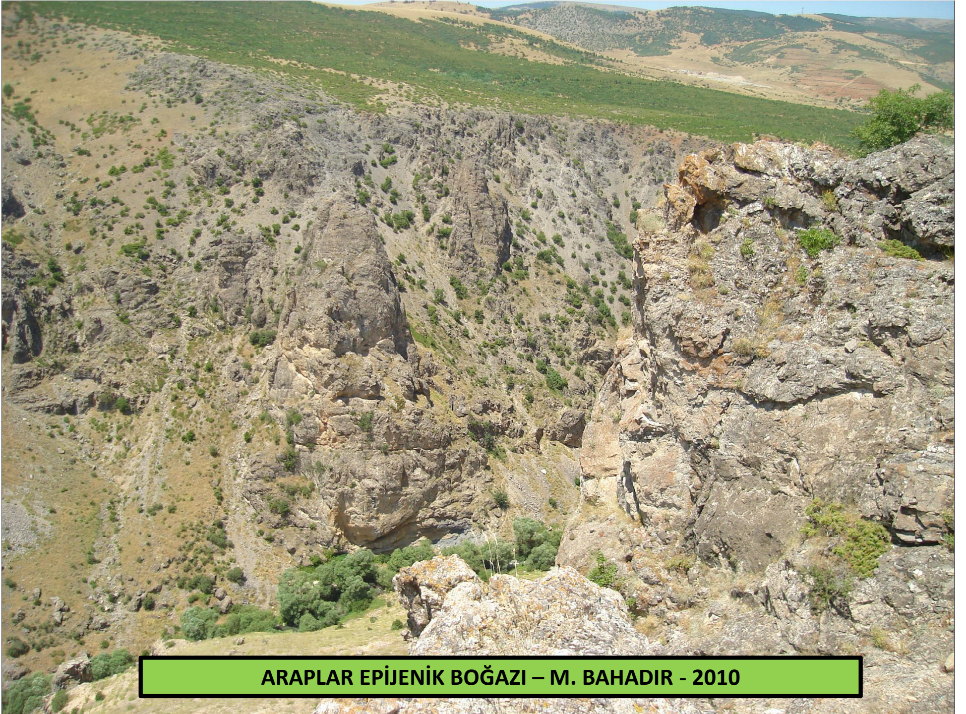
ARAPLAR EPIJENİK BOĞAZI – M. BAHADIR - 2010