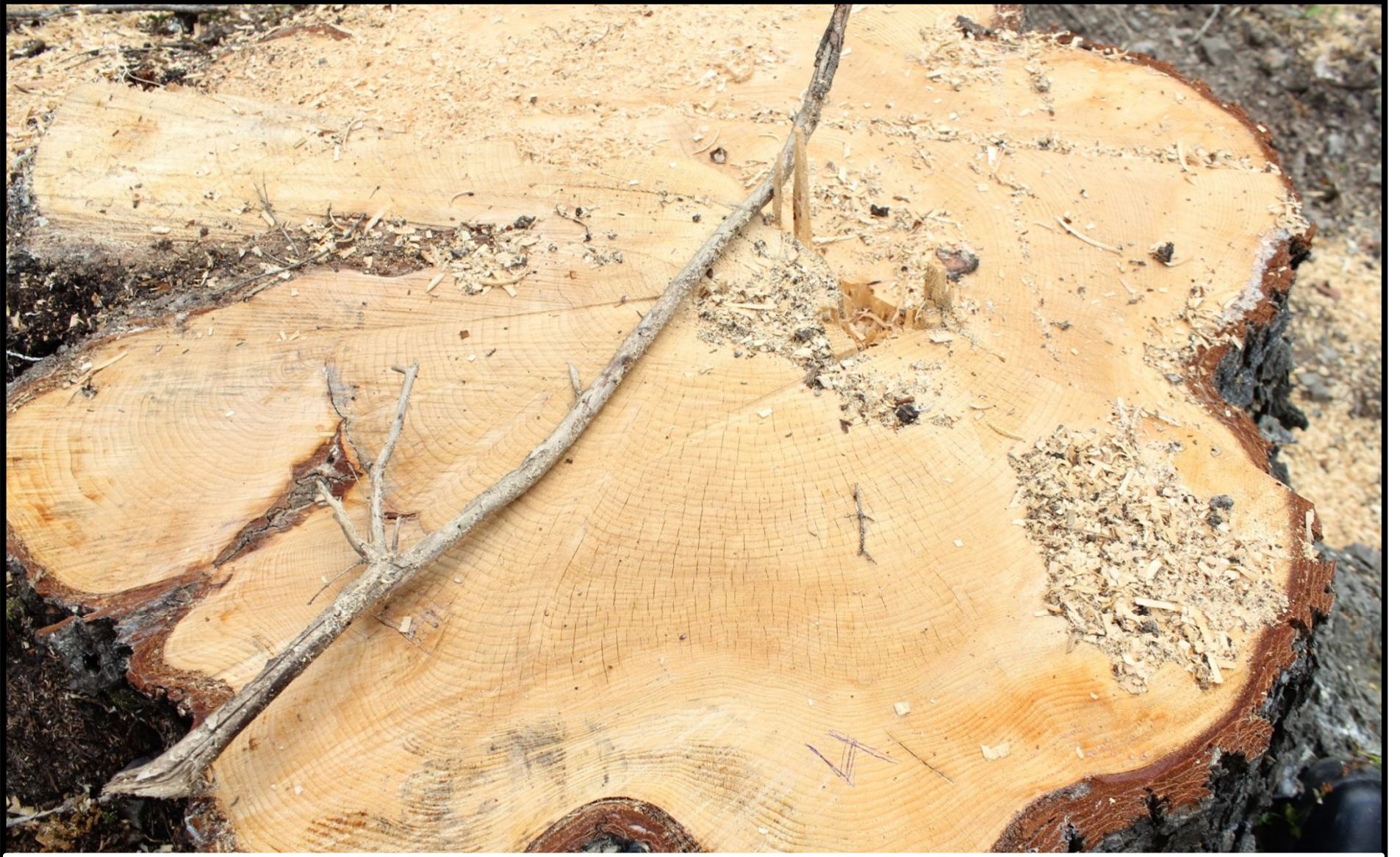
DENDRO KRONOLOJİ İÇİN AĞAÇ HALKASI - AKSU ÇAYI YUKARI ÇIĞIRI – M. BAHADIR -2015