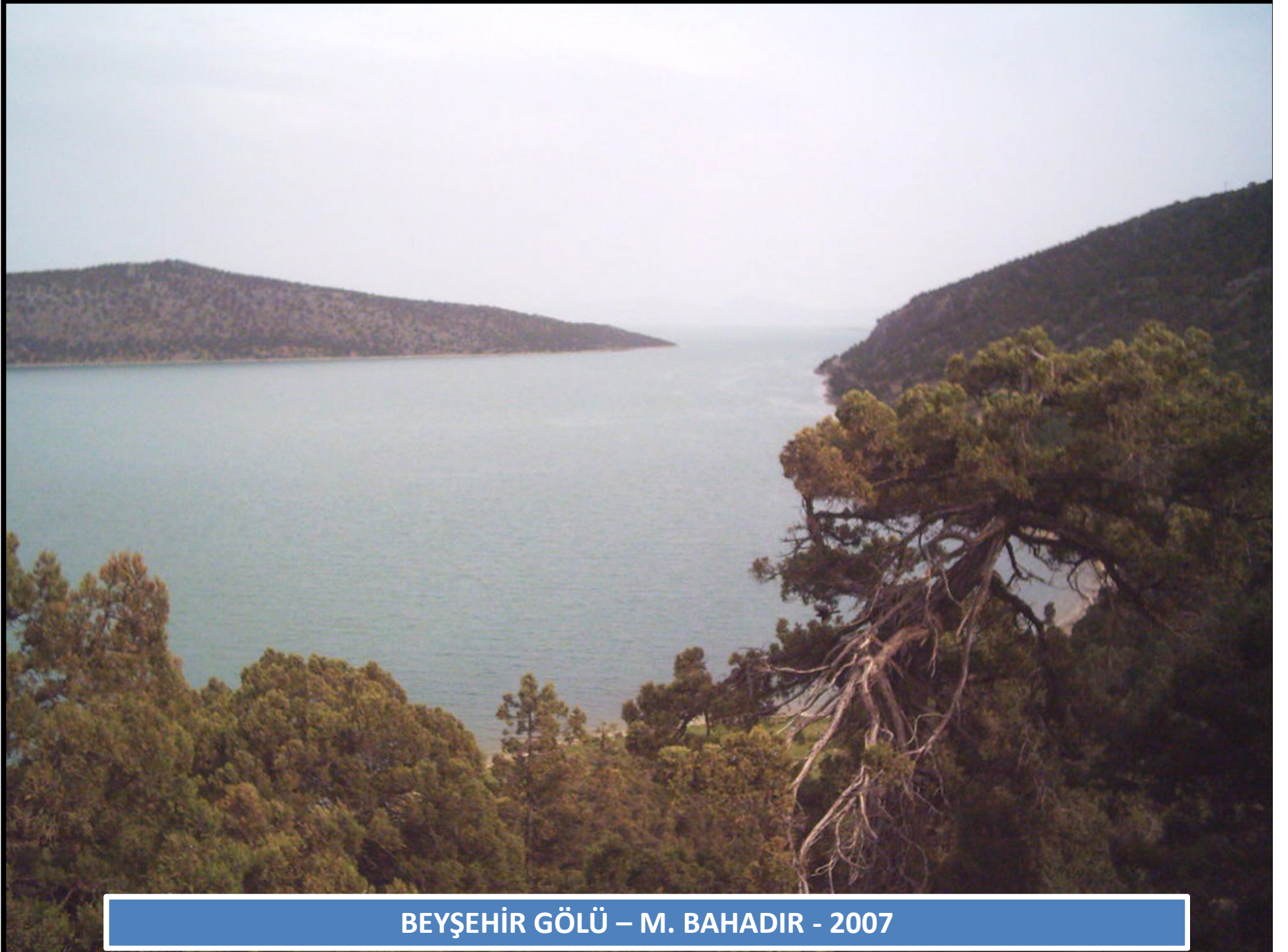
BEYŞEHİR GÖLÜ – M. BAHADIR - 2007