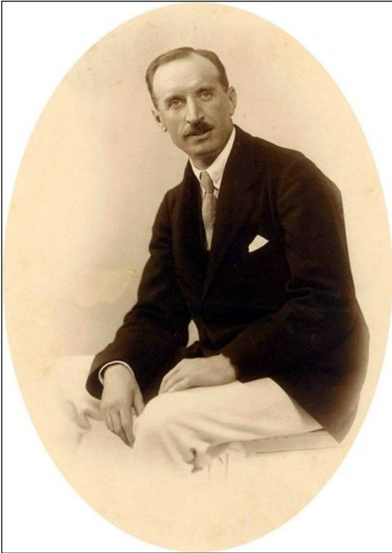
İttihad ve Terakki'nin liderlerinden Rahmi Bey.

Bugün bu sayfada, bundan tam 104 sene öncesine ait olan bir belge yayınlıyorum. Belge, son dönem Türk Tarihi'nin en önemli siyasi partilerinden olan İttihad ve Terakki'ye ait. 1911'de yapılan ara seçimler öncesinde Selânik'te kendilerine muhalif olan gayrimüslim nüfusun fazlalığı sebebiyle sandıkta bozguna uğramaları ihtimalinin yüksek olduğunu gören İttihadçılar, çareyi şehre 20 bin Müslüman seçmen nakledilmesinde buluyorlar.