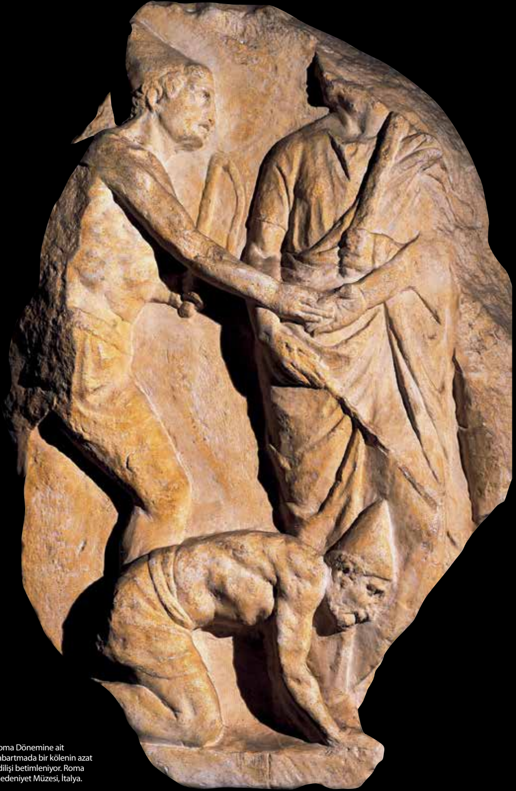
Roma Dönemine ait kabartmada bir kölenin azat edilişi betimleniyor. Roma Medeniyet Müzesi, İtalya.

Köle olmak Antik Çağda; ama en çok da Romalılar nezdinde bir insanın başına gelebilecek en kötü olaylardan biri olmalıydı. Zira Roma hukukuna göre köle bir şahıs değil, bir “eşya” idi. Bu nedenle eşya ile borçlar hukukunda bir mal olarak görülürdü. “Mal sahibi kişi”, kölesi üzerinde her türlü hakka sahipti; isterse yaralayabilir, sakatta bırakabilir ve hatta öldürebilirdi. Digesta ’da Ulpianus’a atfedilen bir bölümde “ Ius civile (vatandaşlık hukuku) nazarında köleler hiçtirler; ancak ius naturale (tabii hukuk) nazarında böyle değildir. Zira tabii hukuk karşısında bütün insanlar eşittir” diye yazmaktadır. Ancak Roma, hiçbir zaman uygulamada köleleri hukuk önünde “insan” olarak değerlendirmemiş ve köleliğin kaldırılması için çaba göstermemiştir. Aksine köleliği güçlendirici yönde kanunlar çıkartmıştır. Roma hukukunda köle şahıs olmamakla