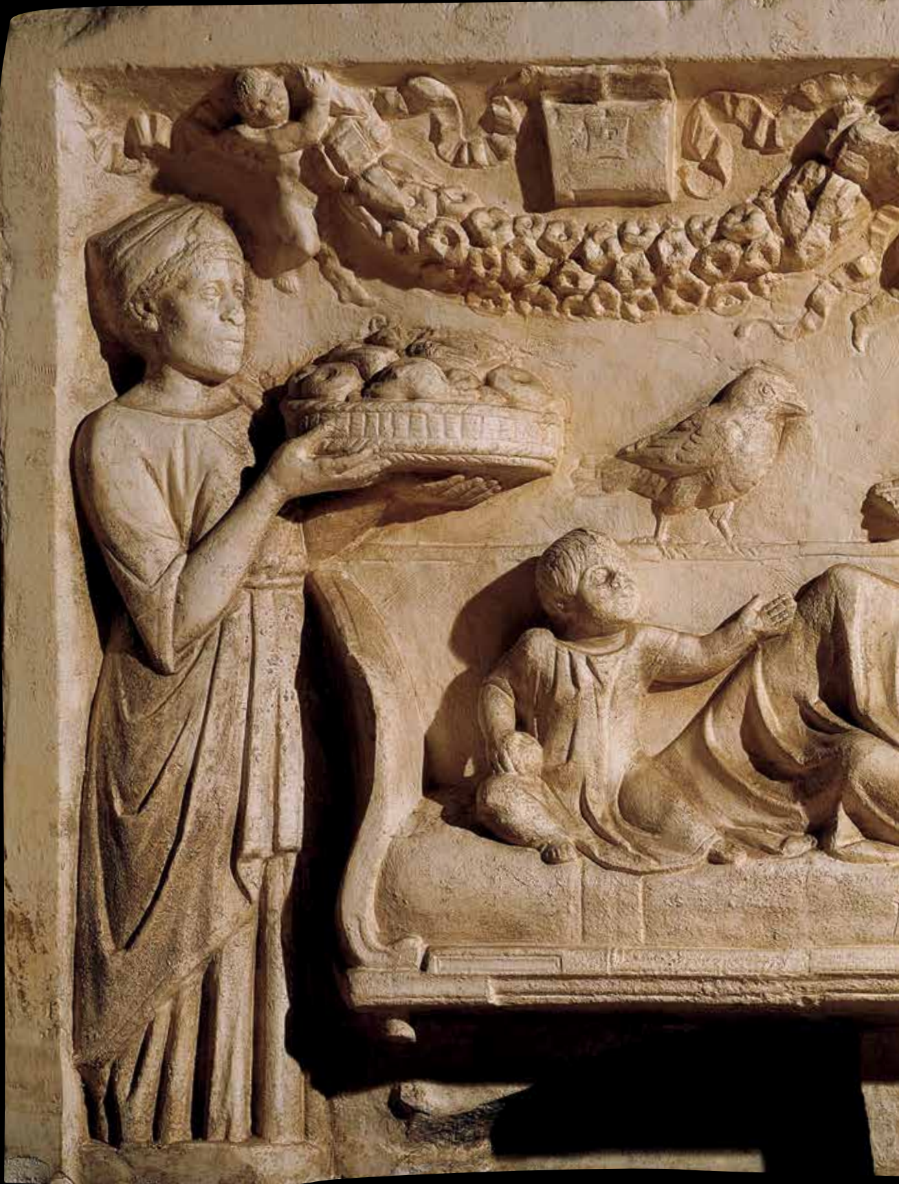
MS 2. yüzyıl tarihli kabartmada bir ziyafet sahnesi betimleniyor. Kline üzerinde uzanmış bir kadın ve çocuğunun yer aldığı sahnede bir hizmetçinin onlara yemek getirdiği görülüyor. Roma Medeniyet Müzesi, İtalya.