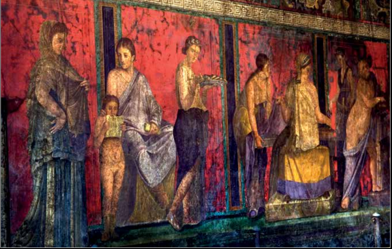
Pompeii'de bulunan Gizemler Villası'ndaki freskler kadın köleler ve hizmetkarlar betimleniyor. MS 1. yüzyıl. Pompeii, Napoli, İtalya.