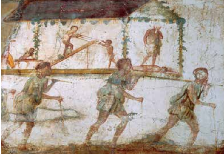
Pompeii'de bulunan 'Marangoz Atölyesi'nin duvarlarını süsleyen freskte marangozları taşıyan köleler betimleniyor. MS 1. yüzyıl, Napoli Ulusal Arkeoloji Müzesi, İtalya.

beraber insan olmasından ötürü, sahibi tarafından bazı imkânlara sahip olabilirdi. Eğer köle eğitilmiş ya da zeki