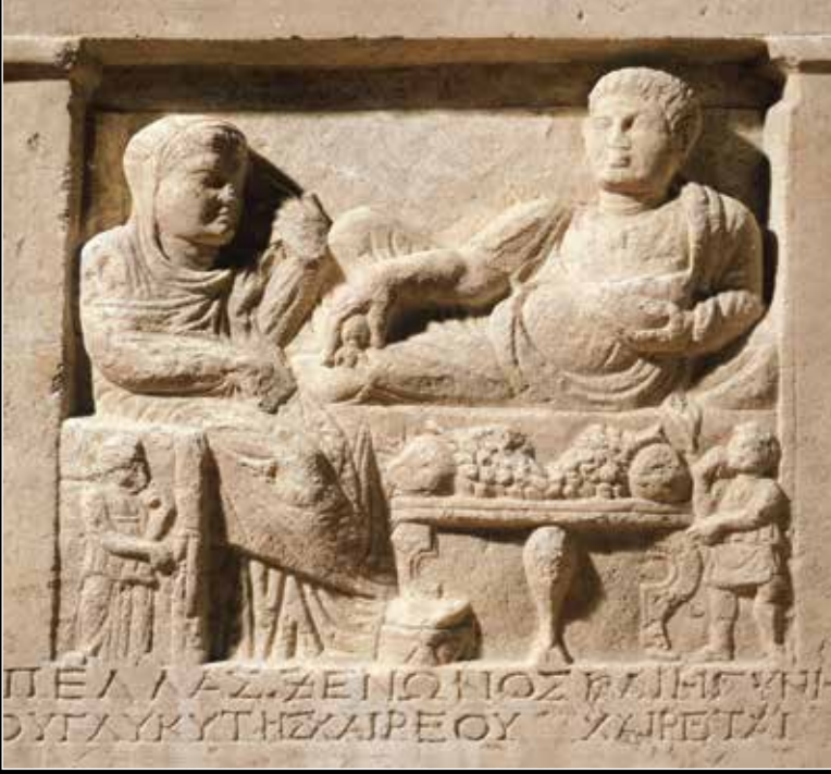
Bulgaristan'da bulunan Roma DÖneminde ait bir mezar stelindeki cenaze şöeni sahnesinde alt köşelerde küçük boyutlu olarak betimlenen köle figürleri görülüyor. MS 2. yüzyıl, Sofya Ulusal Arkeoloji Müzesi, Bulgaristan.