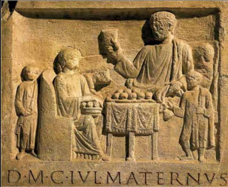
Roma Dönemine ait kabartma üzerinde cenaze şöeni ve şöende hizmet eden köle figürleri betimleniyor. MS 1. yüzyıl. Köln, Almanya.

Bir başka hürriyetin kaybedilmesi durumu da, özgür bir Romalının mahkeme önünde alacaklı kişiye borcunun