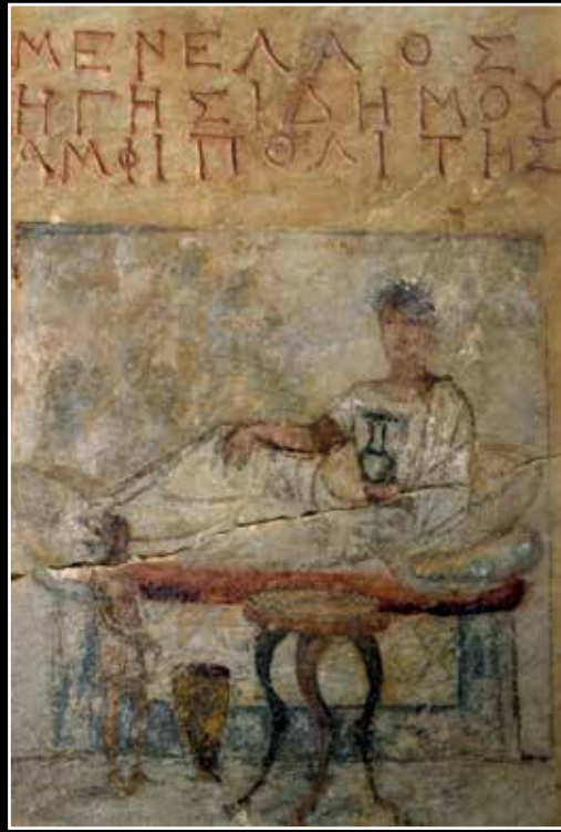
Yunanistan'daki Dimitriada Nekropolü'nde bulunan Roma Dönemine ait mezar steli üzerinde betimlenen ziyafet sahnesinde bir köle efendisine hizmet ediyor. Volo Arkeoloji Müzesi, Yunanistan.

İnsanlar köle ya da özgür olmalarına bakılmaksızın kaçırılıyorlar ve bazı büyük çiftliklerin hapishanelerinde tutuluyorlardı. Bu nedenle Augustus uygun noktalara polis merkezleri kurdurarak, haydutluğu kontrol altına almaya çalışmış; çiftliklerdeki köle kamplarını kontrol ettirmiştir. Bir kentten bir kente yolculuk yapmak, özellikle de zenginler için oldukça tehlikeliydi: Genç Plinius, arkadaşı Attilius'un, Robustus adında tanınmış