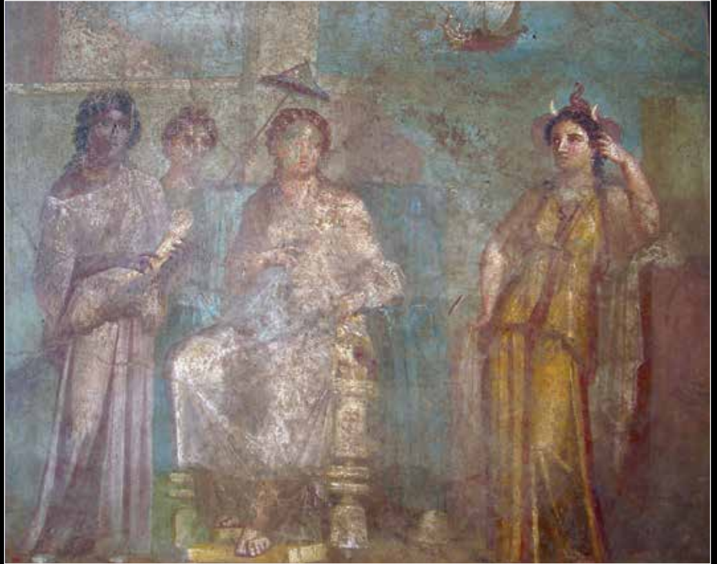
Pompeii’de bulunan freskte Romalı kadınlar ve siyahi köleler betimleniyor. Pompeii, Roma, İtalya.

Roma’nın ilk yıllarında kölelik, ev köleliğinden ibaretti. Bu köleler, genel olarak diğer aile bireylerinden farklı bir muamele görmezlerdi. Ailenin diğer üyeleri gibi, kendi topraklarını eker ve çiftçilik işleri yapabilirlerdi.