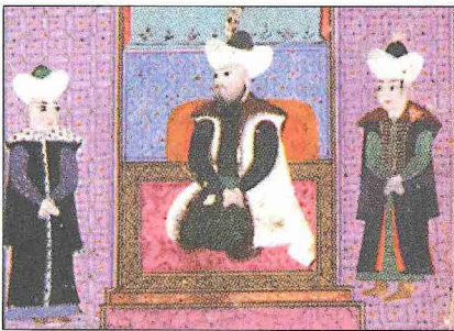
I. Murad'ı tahtında tasvir eden bir minyatür (Silsilenâme-i Âli-i Osmân, İÜ Ktp., TY, nr. 9365)

I. Murad, Bizans'a ve Haçlılar'a karşı Trakya'daki fetihleri korumak ve İstanbul doğrultusunda yeni fetihler yapmak için daha önce Receb 767'de (Mart 1366) Rumeli'ye geçmiş, Gelibolu Boğazı yoluyla Malkara'ya gelmişti. İdris-i Bitlisî'ye göre beş yıl Rumeli'de kalan I. Murad bu zaman zarfında Bizans ve Bulgar topraklarında birçok fetihle bulundu. Meriç nehri üzerinde Edirne yakınında Çirmen (Çirmianon / Tshronomen) üstüne kuvvet gönderdi, kale eman dileyip teslim oldu. I. Mu-