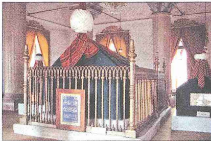
I. Murad'ın türbesi ve sandukası – Bursa

Balkanlar'da yayılma politikasında Osmanlılar'ı durdurabilecek büyük güç Macaristan idi. Ancak yeni Macar Kralı Sigismund'un Tuna'nın diğer yakasında nüfuzunu sürdürme siyaseti onu Lazar ve Bosna kralıyla karşı karşıya getirmiş, bu durum Kosova Savaşı arefesinde I. Murad'ın işine yaramıştır. Gazânâme 'ye göre Sırp, I. Murad'ın planını ve askerinin durumunu öğrenmek için bir elçi gönderilmesine karar vermişler, Lazar'ın tavrına öfkelenen I. Murad ordusuyla harekete geçip Kiçi Morava'nın dar dağ geçidinden Kosova ovasına inmek zorunda kalmış ve ovada Gümüşhisar (Lipljang) önünde ordugâhını kurmuştur.