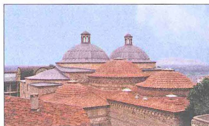
I. Murad dönemine ait Eski Kaplıca – Bursa

I. Murad devrinin temel kaynakları arasında özellikle Türkçe kronikler dikkati çeker. Bu dönem için Yıldırım Bayezid zamanına kadar gelen ve bugün kayıp olan Yahşi Fakih Menâkıbnâmesi , Âşıkpaşazâde Târîhi içinde özetlenmiştir (İnalçık, Studies in Ottoman , s. 139-156). I. Murad devrinin çağdaş kaynakları olarak Esterâbâdî'nin Bezm ü Rezm 'i (İstanbul 1928), Neşri'nin Cihannümâ'sı içinde (I, 210-310) yer alan Ahmedî'nin Gazânâme'si önemlidir. Ahmedî'nin Dâstân ve Tevârih-i Mülûk-i Âli-i Osmân 'ını, Âşıkpaşazâde Târîhi 'ni, Rûhî ve Takvimler 'i az değişikliklerle ve kendine göre bir tarih sıralaması ile kelime kelime aktaran, 1366-1385 dönemindeki Sirbistan seferlerini bir arada vererek kronolojiyi tam karışıklığa dönüştüren Neşri, 1385-1389 devresi için Kosova Savaşı'nda Şehzade Bayezid'in yanında bulunması muhtemel şair Ahmedî'nin Gazânâme'sini aynen nakletmiştir. Bu kısım “Hikâyet-i Feth-i Niş” ile başlar, “Cülûs-i Bâyezîd Han”a kadar gelir. Bu metnin Ahmedî'nin kaleminden çıktığı, onun İskendernâme adlı büyük eserindeki aynı beyit ve ifadelerle tesbit edilmiştir (İnalçık, Kosova , s. 21-26). Osmanlı şeh-nâmelerinin ilki sayılabilecek bu Gazânâme 'yi yazarken Ahmedî, Vezir Çandarlı Ali Paşa, Gazi Evrenos, Sultan Bayezid ve hatta Sırp tanıklardan yararlanmıştı. I. Murad dönemine ait olduğu iddia edilen mektuplar ise (Feridun Bey, I, 89-116) vekâyî-nâmelerdeki bilgilere göre uydu-rulmuş metinlerdir (Yınanç, XI/62-77 [1339], s. 161-168; XI/63, s. 77-81).