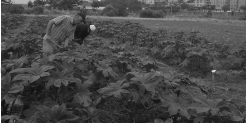
Resim – 7 Hint Yağ Bitkisi Çapalama

Hintyağı tohumları ekildikten, birkaç hafta sonra çıkışı takip edilmelidir, gerekli hallerde seyreltme yapılmalıdır. Bu yöntem yabancı otların kontrol altına alınmasını sağlar. Yabancı otlarla mücadele etmek için kültivatör kullanılabilir (Oplinger ve ark. 2010).