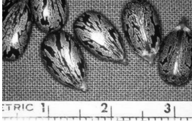
Resim – 5 Hint Yağı Tohumu

Hintyağının tohum yatağı, keten, mısır, sorgum, pamuk, soya ve diğer endüstri bitkilerinde olduğu gibi hazırlanır. Ekim zamanı ise çok dikkatli seçilmelidir. Toprağın sıcaklığı yeterli olduğunda ve donma tehlikesi ortadan kalktıktan sonra ekim yapılmalıdır.