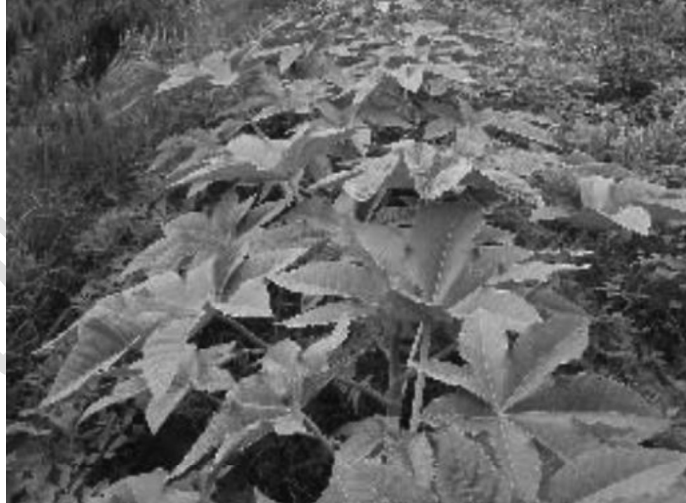
Resim – 6 Vejetatif Devrede Hint Yağ Bitkisi