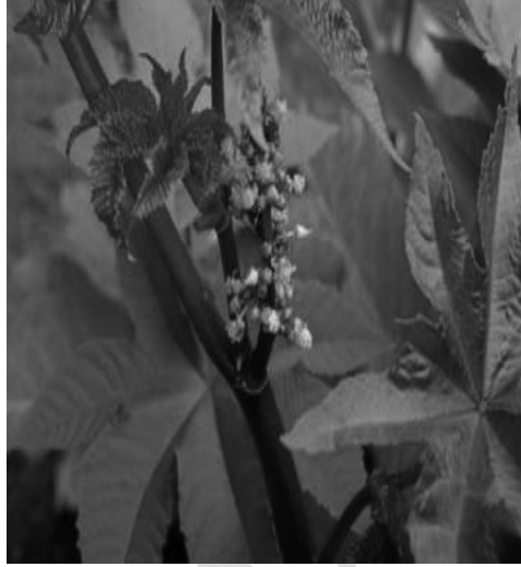
Resim – 3 Hint Yağı Yaprak Yapısı