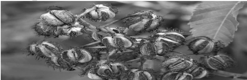
Resim – 9 Hint Yağ Bitkisi Olgunlaşma

Hasat zamanı gecikmesi kapsüllerin çatlaması nedeniyle tohumların dökülmesi sebep olabilir. Hintyağı bitkisi hasat esnasında çok kuru olduğu için çabuk kırılmaktadır. Bu nedenle hasat makinelerinin daima silindir temizliğine ve hızına dikkat etmek gerekir. Hintyağından elde edilen ürün miktarı farklı koşullara (örneğin ekim miktarına, çeşide, mevsime, ekim koşullarına ve hasat esnasında uygulanan yöntemlere) göre değişir. İyi sulama koşullarında hektara 900-1000 kg ürün elde edilebilir. Ama yağış veya sulama miktarı yeterli olmayınca ürün miktarı hektara 300–400 kg'a kadar düşebilir. Yağ oranı ise farklı koşullarda değişmektedir, ama genelde % 35–55 arasındadır. Yağ verimi ise hektara 300- 600 kg arasında değişmektedir (Babagiray 1989; Oplinger ve ark. 1990; Labalette ve ark. 1996; Baldwin ve Robert 2008). Yağlı tohumların depolanması çok zor bir işlemdir.