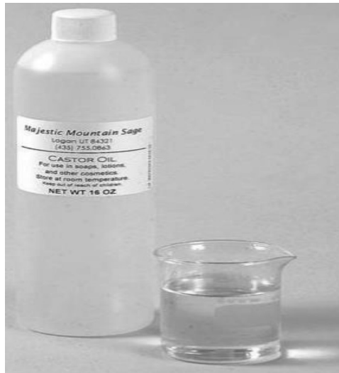
Resim – 1 Hint Yağının Yağı