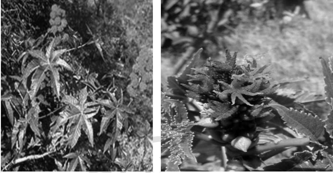
Resim – 4 Hint Yağı Çiçek Yapısı

bir karpel yavaş yavaş kuruyup açılmakta ve zaman geçtikçe tohumlar dışarıya dökülmektedir (Ombrello, 1995). Ayrıca tohumların şekil ve büyüklükleri türlere göre değişmektedir. Çok yıllık bitkilerin tohumları daha büyük parlak yeşil, kahverenginde iken, tek yıllık bitkilerin tohumları daha küçük, koyu yeşil renğinde olup, kırılgan bir yapıya sahiptir. Tohumların baş kısmında Karunsal (Caruncel) adı verilen sünger gibi bir yapı bulunmaktadır ki, ekilen tohum buradan su almaktadır (Mosto, 1989). Tohumları steroller, risin, zehirli bir toksalbümin olan Risinin alkaloidi, E vitamini içeren Oleum risini ve bazı fermentleri de içermektedir. Tohumlarında % 35–55 civarında yağ bulunmaktadır. Ticari türlerde yağ oranı % 40–60 „lara yükselmektedir (Knight 1979; Moshkin 1986).