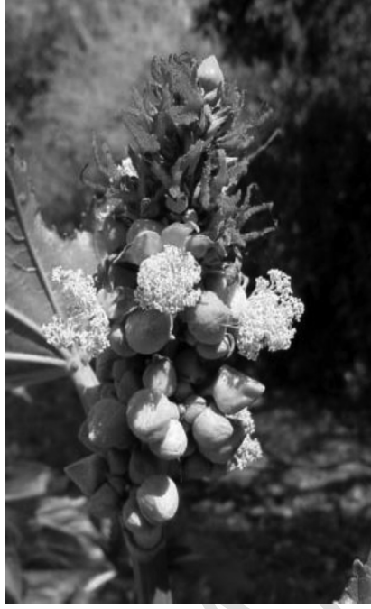
Resim – 8 Hint Yağ Bitkisi Tohum Bağlama

Hasat zamanı gecikmesi kapsüllerin çatlaması nedeniyle tohumların dökülmesi sebep olabilir. Hintyağı bitkisi hasat esnasında çok kuru olduğu için çabuk kırılmaktadır. Bu nedenle hasat makinelerinin daima silindir temizliğine ve hızına dikkat etmek gerekir. Hintyağından elde edilen ürün miktarı farklı koşullara (örneğin ekim miktarına, çeşide, mevsime, ekim koşullarına ve hasat esnasında uygulanan yöntemlere) göre değişir. İyi sulama koşullarında hektara 900-1000 kg ürün elde edilebilir. Ama yağış veya sulama miktarı yeterli olmayınca ürün miktarı hektara 300–400 kg'a kadar düşebilir. Yağ oranı ise farklı koşullarda değişmektedir, ama genelde % 35–55 arasındadır. Yağ verimi ise hektara 300- 600 kg arasında değişmektedir (Babagiray 1989; Oplinger ve ark. 1990; Labalette ve ark. 1996; Baldwin ve Robert 2008). Yağlı tohumların depolanması çok zor bir işlemdir.