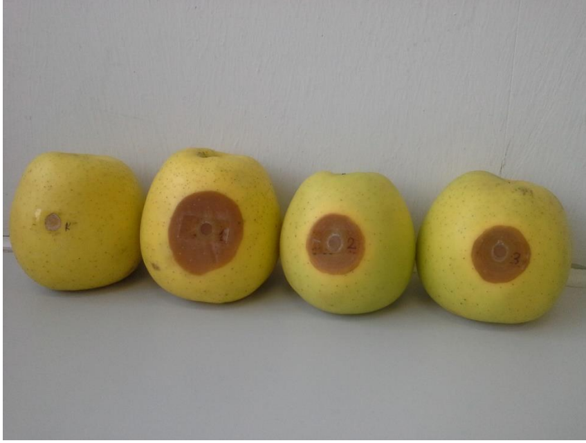
Şekil 4.1.2. Elma testinin sonunda Cryphonectria parasitica izolatlarının oluşturduğu lezyonların görünümü (soldan sağa; kontrol, 1 no'lu izolat, 2 no'lu izolat ve 3 no'lu izolat)