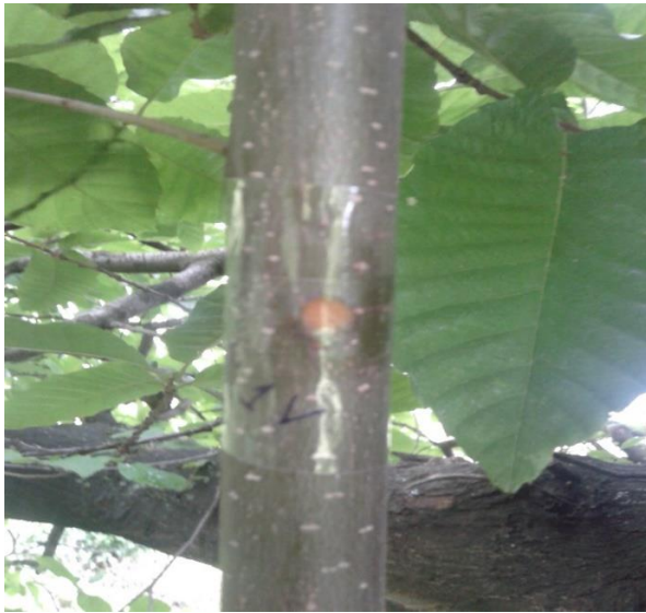
Şekil 4.2.1. Cryphonectria parasitica izolatı ile inokule edilmiş bir kestane dalı

Bu test kestane ormanında ve kestane ağacı üzerinde Şekil 4.2.1’de görüldüğü şekilde başlatılmış ve inokulasyondan sonra birer aylık aralıklarla kanser yaralarının oluşup oluşmadığı gözlenmiş (Şekil 4.2.2) ve oluşanların mm olarak dal boyunca uzunlukları ölçülerek kaydedilmiştir.