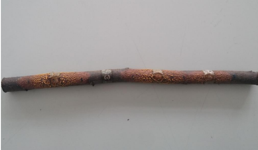
Şekil 4.3.2. Plastik kaplarda kesik dal parçası testinde kullanılan bir kestane dalının inokulasyondan 30 gün sonraki görünümü