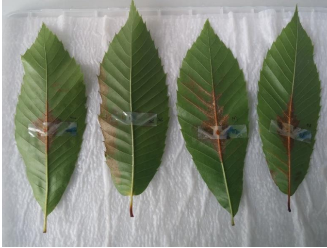
Şekil 4.5.2. Cryphonectria parasitica 'nın patojenisitesinin yaprak testinde inokulasyondan 10 gün sonraki görünümü