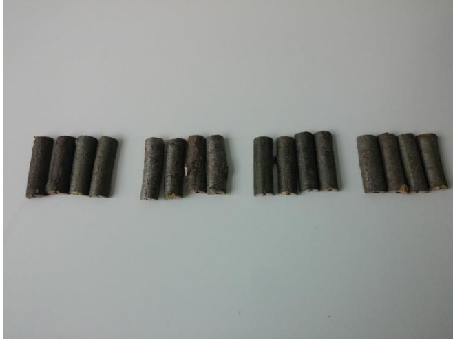
Şekil 4.4.1. Petri koşullarında kesik dal parçası testinde C. parasitica ile inokule edilmiş dal parçaları

Bu test plastik kaplarda kesik dal parçası testine göre gerek daha küçük bir alanda daha fazla sayıda izolatin değerlendirilmesine olanak sağlaması gerekse daha kısa sürede sonuç vermesi açısından önemlidir. Bu çalışmada, testin başlangıç görüntüleri Şekil 4.4.1’de, test sonundaki görüntüleri Şekil 4.4.2’de ve test sonucunda elde edilen veriler Çizelge 4.4.1’de görülmektedir.