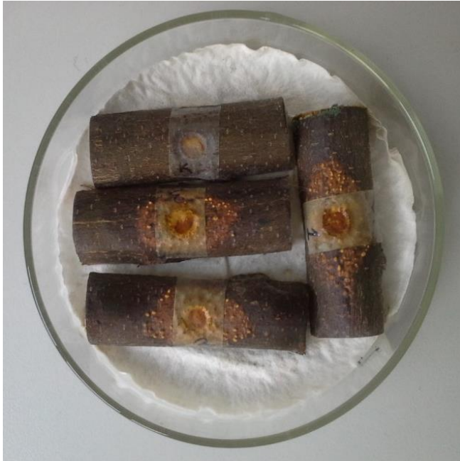
Şekil 4.4.2. Cryphonectria parasitica 'nın petri koşullarında kesik dal parçası testinde inokulasyondan 8 gün sonra oluşturduğu kanser lezyonlarının görünümü