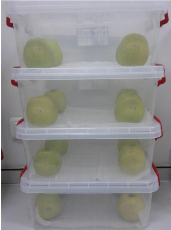
Şekil 4.1.1. Elma testinde C. parasitica ile inokule edilmiş elmaların inkübasyonundan görünüm

Bu test Golden Delicious elma çeşidinin yaklaşık olarak aynı büyüklükteki temiz ve sağlıklı meyveleri ile yapılmış olup, test başlangıcındaki durum Şekil 4.1.1’de ve testin sonundaki meyvelerde kanser gelişimi Şekil 4.1.2’de görülmektedir.