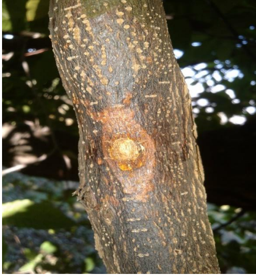
Şekil 4.2.2. Bir Cryphonectrica parasitica izolatının canlı kestane dalında inokulasyondan yaklaşık 2 ay sonra oluşturduğu kanser belirtisi