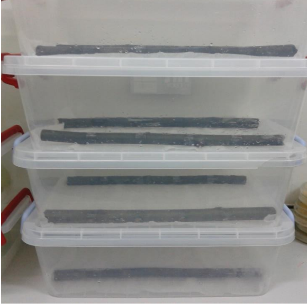
Şekil 4.3.1. Plastik kaplarda kesik dal parçası testinin genel bir görünümü

Bu test belirli uzunluktaki kestane dalları ile yapılmakta olup, bu çalışmada 30 cm uzunluğunda kestane dalları kullanılmıştır. Kestane ağacından alındığı gün laboratuvar ortamında ve plastik kaplar içerisinde yapılan bu testte (Şekil 4.3.1. ve Şekil 4.3.2) kanser uzunlukları patojenin inokulasyonundan 15 ve 30 gün sonra ölçülerek değerlendirilmiştir (Çizelge 4.3.1 ve 4.3.2).